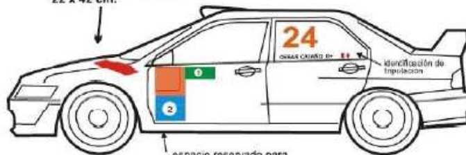
espacio reservado para los organizadores 1. 70 x 15 cm. 2. 50 X 35 cm.